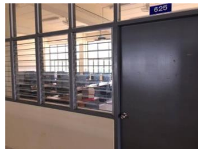
ห้องปฏิบัติการคอมพิวเตอร์