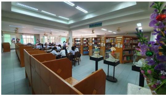
ห้องสมุด