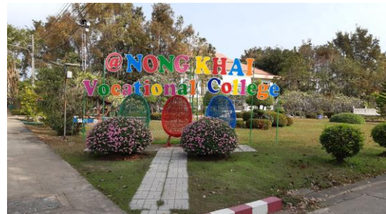
จุดเช็คอินวิทยาลัย