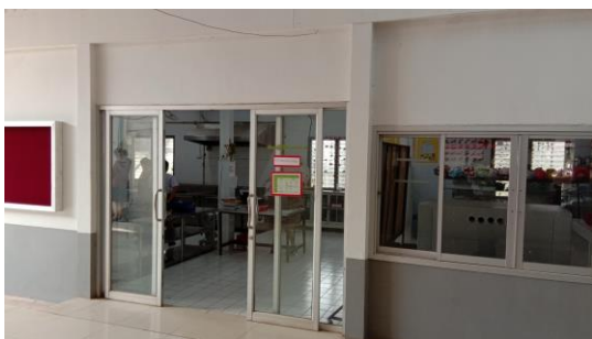
ห้องเรียนสาขาวิชาอาหารและโภชนาการ