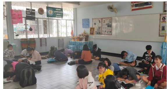
ห้องกิจกรรมลูกเสือวิสามัญ