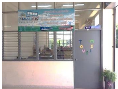
ห้องพักครู