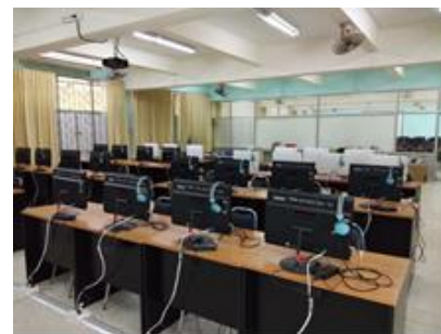
ห้องปฏิบัติการทางภาษา