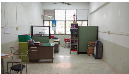
ห้องขายตรง