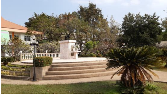
พระบรมรูปทรงม้า