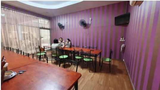
ห้องรับประธานอาคาร บุคลากรในวิทยาลัยฯ