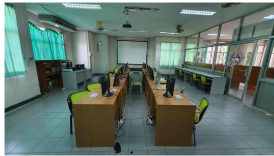
ห้องปฏิบัติการคอมพิวเตอร์