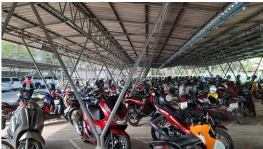
โรงจอดรถ