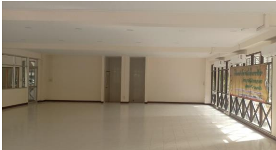
ห้องภายในอาคาร

ลักษณะอาคารคอนกรีต ๔ ชั้น ๑,๐๘๘ ตร.ม. ก่อสร้าง พ.ศ. ๒๕๖๒ ใช้งานได้ วงเงิน ๑๑,๔๕๐,๐๐๐ บาท (งปม.) ในอาคารมีห้องดังนี้