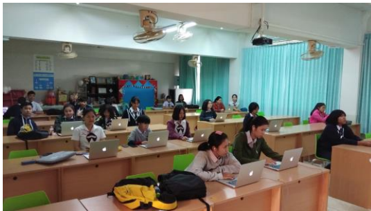
ห้องปฏิบัติการคอมพิวเตอร์