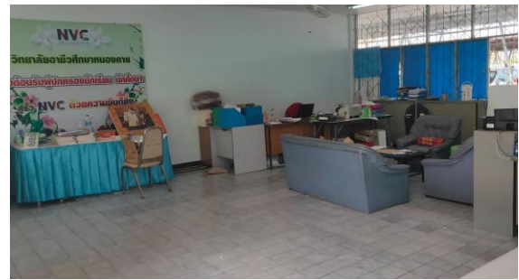
ห้องงานปกครอง