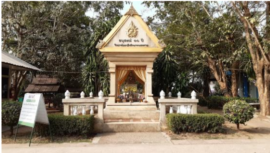
พระบรมรูปทรงม้า