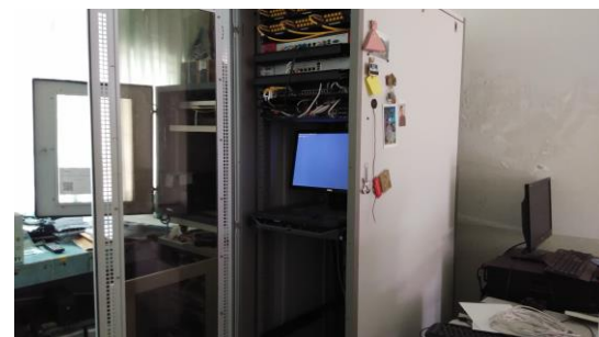
ห้องศูนย์ควบคุมระบบเครือข่ายสารสนเทศ