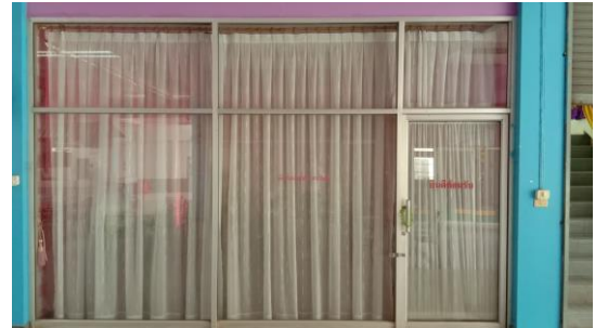
ห้องรับรองผู้บริหารฯ