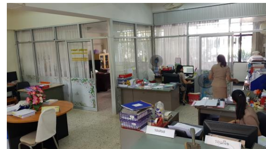
ห้องปฏิบัติงานสำนักงานฝ่ายแผนงาน และความร่วมมือ