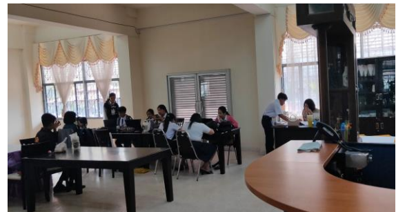
ห้องปฏิบัติการโรงแรม