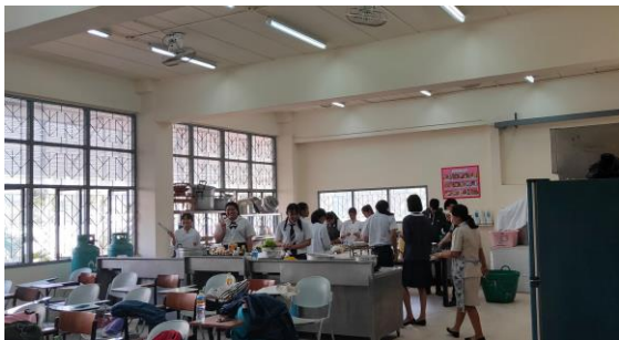
ห้องฝึกปฏิบัติแผนกวิชาอาหารและโภชนาการ