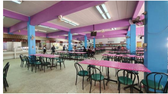
โรงอาหาร