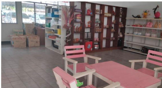
ห้องศูนย์บ่มเพาะ