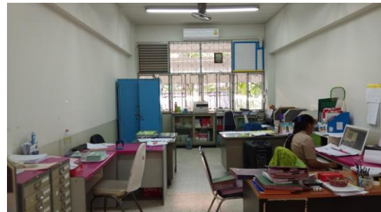
ห้องทวิภาคี