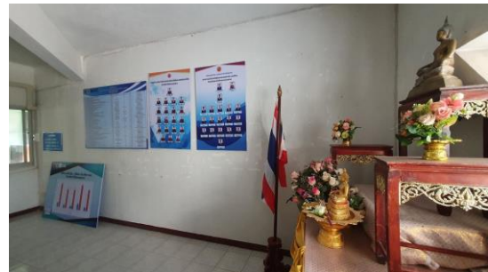
ห้ององค์การวิชาชีพ