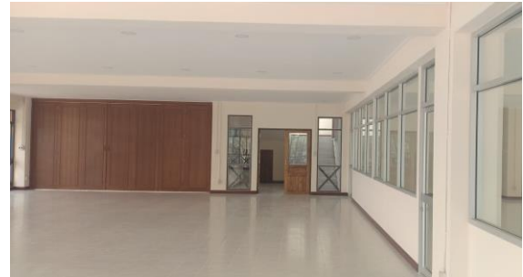
ห้องภายในอาคาร