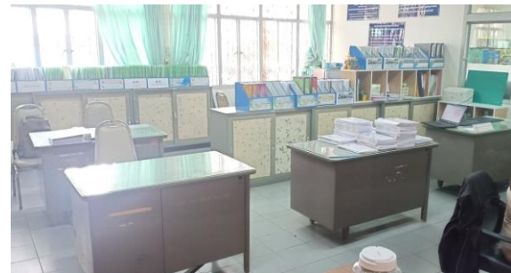
ห้องปฏิบัติการสำนักงานวิจัย