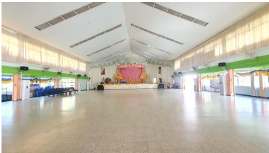
หอประชุม