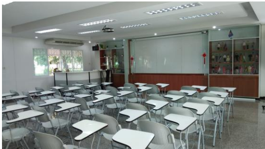
ห้องเรียน Smart Class Room