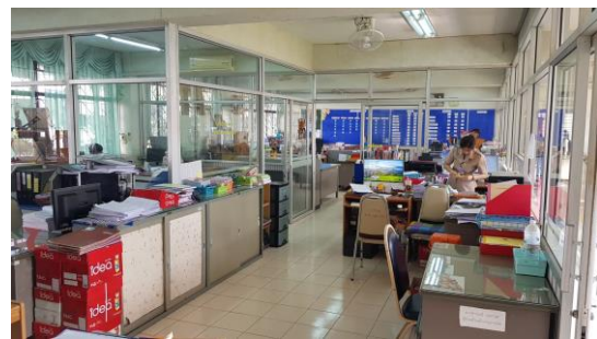
ห้องปฏิบัติงานสำนักงานฝ่ายบริหารทรัพยากร