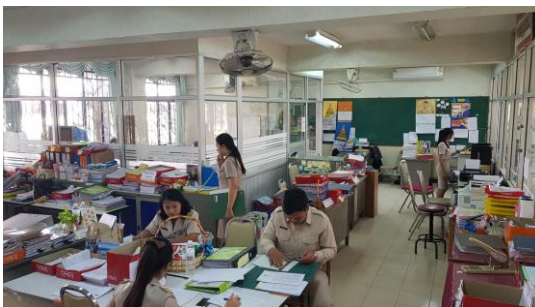
ห้องปฏิบัติงานสำนักงานฝ่ายวิชาการ