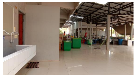
ห้องน้ำและพื้นที่หลังร้านอาหาร