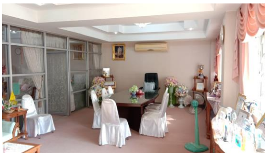
ห้องผู้อำนวยการวิทยาลัยอาชีวศึกษาหนองคาย