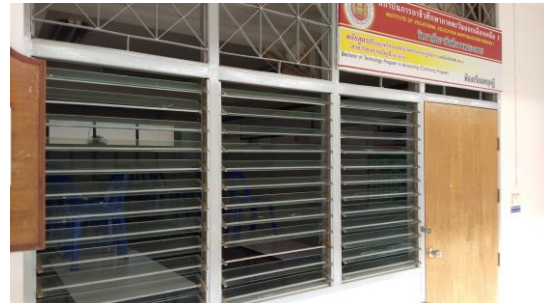
ห้องเรียนทฤษฎี ทล.บ.การบัญชี