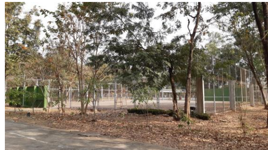
สนามเทนนิส