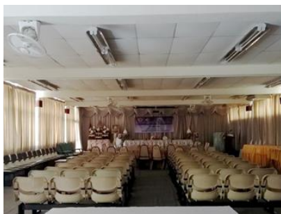
ห้องโสตทัศนูปกรณ์