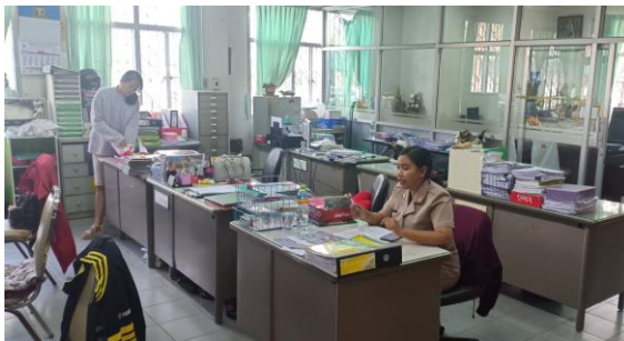
ห้องปฏิบัติการสำนักงานฝ่ายพัฒนากิจการนักเรียน ฯ