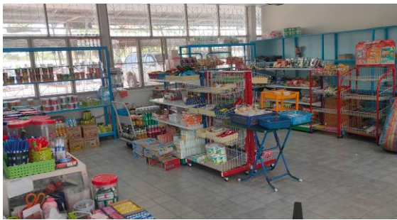
ร้านค้าสวัสดิการ