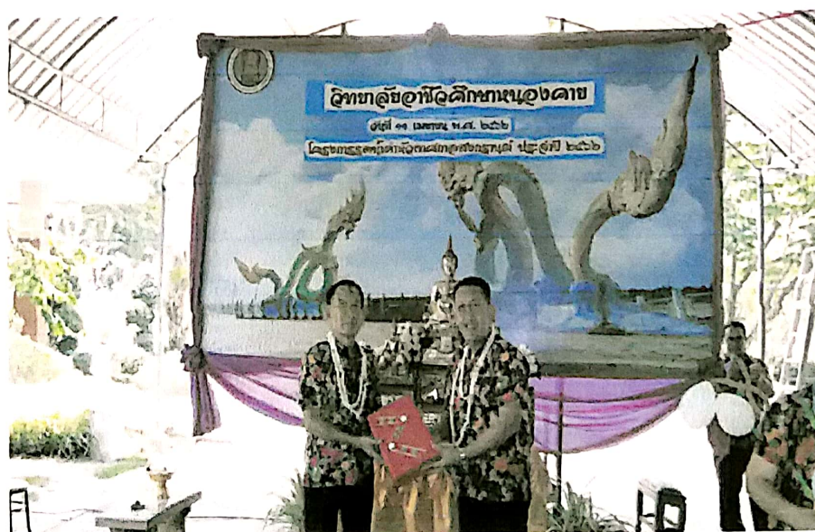
ภาพที่ 4 ผู้อำนวยการวิทยาลัยอาชีวศึกษาหนองคายมอบของที่ระลึก แก่ผู้มีเกียรติ