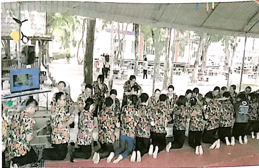
ภาพที่ 3 คณะผู้บริหาร บุคลากรบุคลากรวิทยาลัยอาชีวศึกษาหนองคายร่วมพิธีรดน้ำดำหัวขอพรผู้สูงอายุ