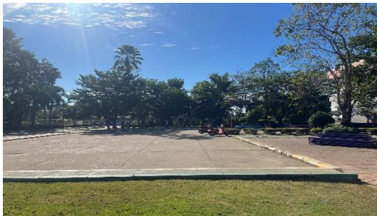
ลานกาสะลอง