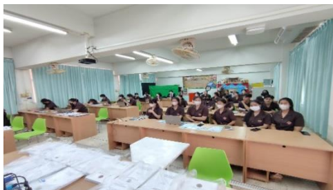
ห้องปฏิบัติการคอมพิวเตอร์