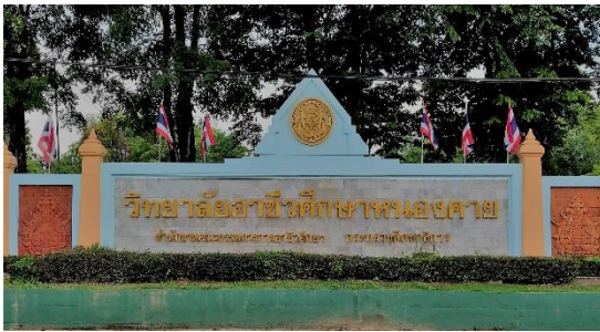
ป้ายหน้าวิทยาลัยอาชีวศึกษาหนองคาย