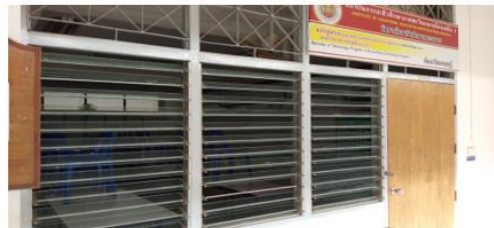
ห้องเรียนทฤษฎี ทล.บ.การบัญชี