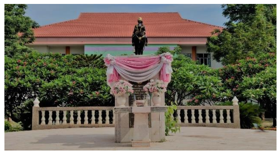
พระบรมรูปทรงม้า