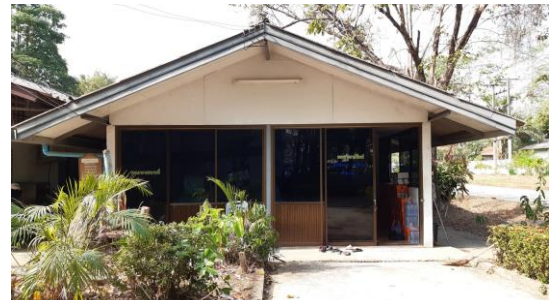
ห้องเอกสารการพิมพ์