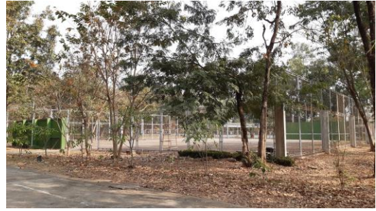
สนามเทนนิส