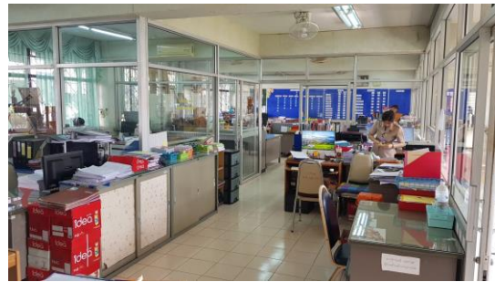
ห้องปฏิบัติงานสำนักงานฝ่ายบริหารทรัพยากร