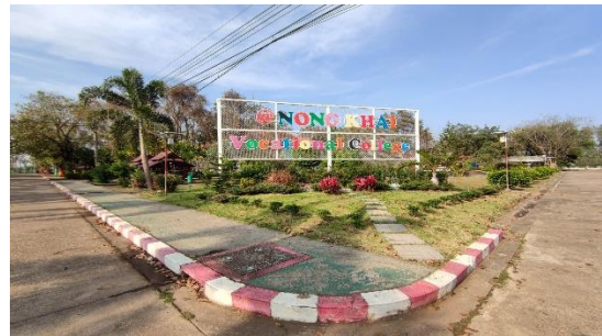
บริเวณจุดถ่ายภาพเช็คอินวิทยาลัย