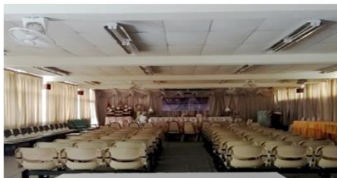
โสตทัศนูปกรณ์