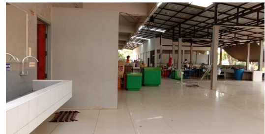
ห้องน้ำและพื้นที่หลังร้านอาหาร