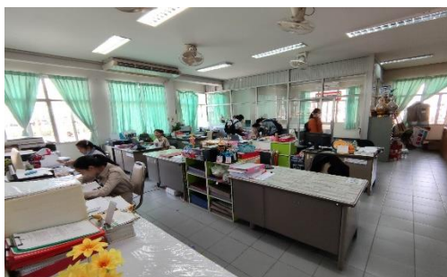
ห้องปฏิบัติการสำนักงานฝ่ายพัฒนากิจการ นักเรียน นักศึกษา