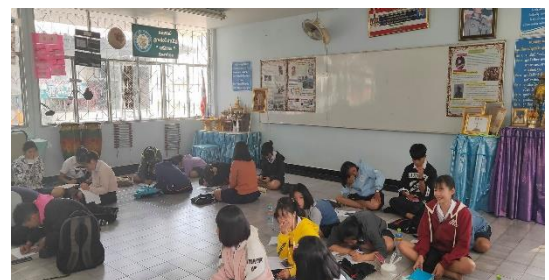
ห้องกิจกรรมลูกเสือ