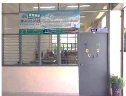
ห้องพักครูแผนกการท่องเที่ยว