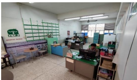
ห้องขายตรง