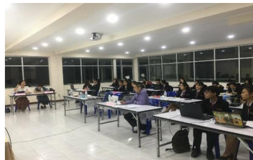
ห้องปฏิบัติการเทคโนโลยีบัณฑิตสาขา การบัญชี