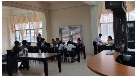
ห้องปฏิบัติการโรงแรม