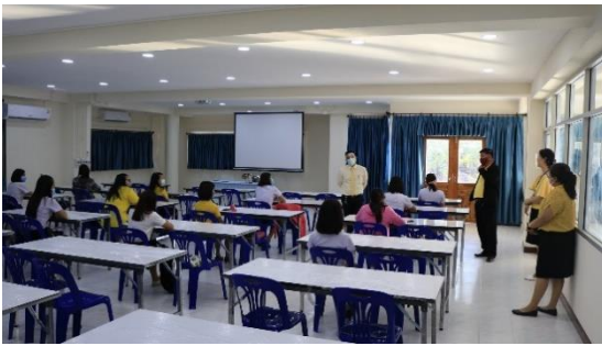
ห้องปฏิบัติการภาษาต่างประเทศธุรกิจ

ลักษณะอาคารคอนกรีต ๔ ชั้น ๑,๐๘๘ ตร.ม. ก่อสร้าง พ.ศ. ๒๕๖๒ ใช้งานได้ดี วงเงิน ๑๑,๔๕๐,๐๐๐ บาท (งปม.) ในอาคารมีห้องดังนี้