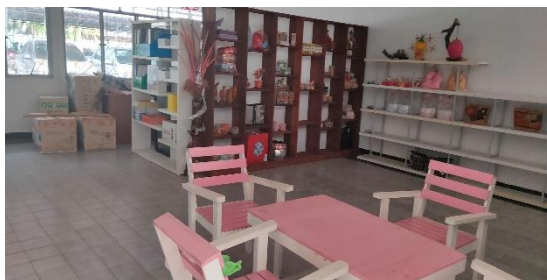
งานศูนย์บ่มเพาะผู้ประกอบการอาชีวศึกษา