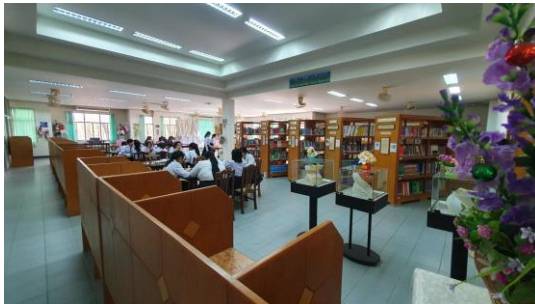
ห้องสมุด