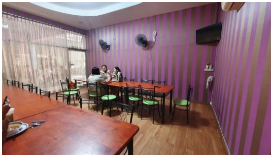
ห้องรับประธานอาคาร บุคลากรในวิทยาลัยฯ