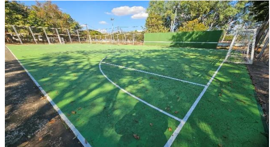
สนามฟุตบอล