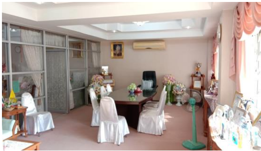
ห้องผู้อำนวยการวิทยาลัยอาชีวศึกษาหนองคาย