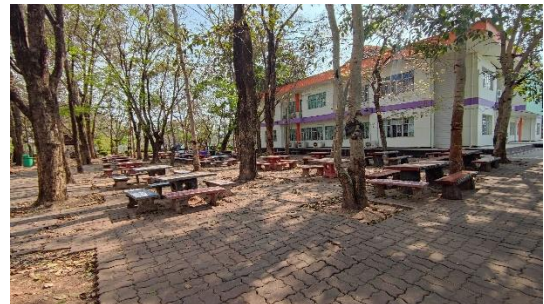
ลานการะเวก ๑