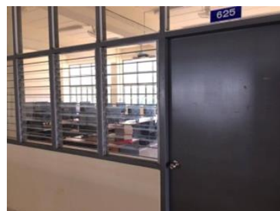
ห้องปฏิบัติการคอมพิวเตอร์