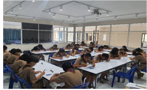
ห้องปฏิบัติการภาษาต่างประเทศธุรกิจ