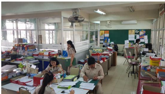
ห้องปฏิบัติงานสำนักงานฝ่ายวิชาการ