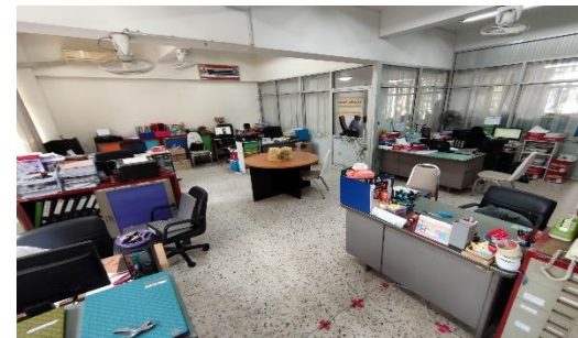
ห้องปฏิบัติงานฝ่ายแผนงานและความร่วมมือ