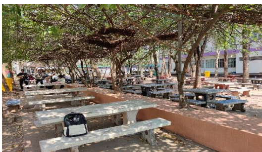
ลานการะเวก ๒