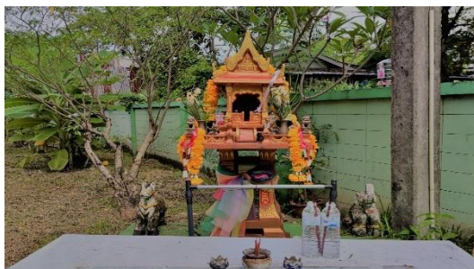
ศาลปู่-ย่า