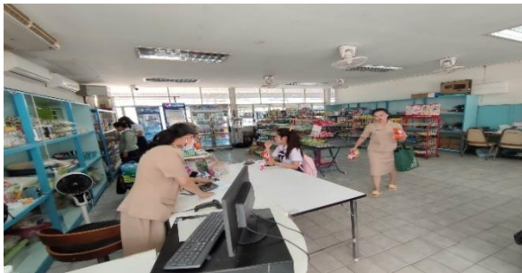
ร้านสวัสดิการเพื่อการฝึกงานนักเรียนนักศึกษา