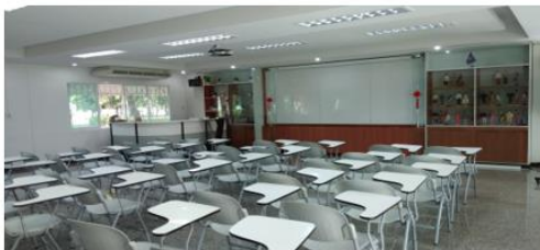
ห้องเรียน Smart Class Roomห้อง