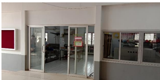
ห้องเรียนแผนกวิชาอาหารและโภชนาการ