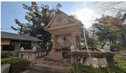
อนุสรณ์ ๑๐ ปี วิทยาลัยอาชีวศึกษาหนองคาย