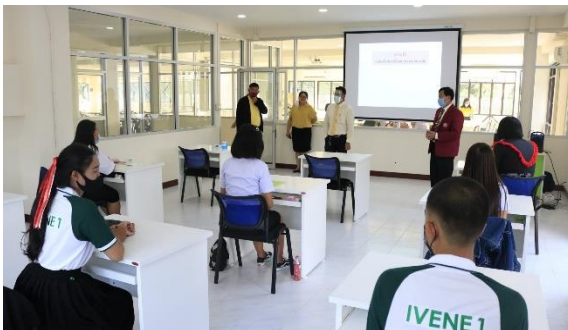
ห้องปฏิบัติการเทคโนโลยีบัณฑิตสาขาการตลาด