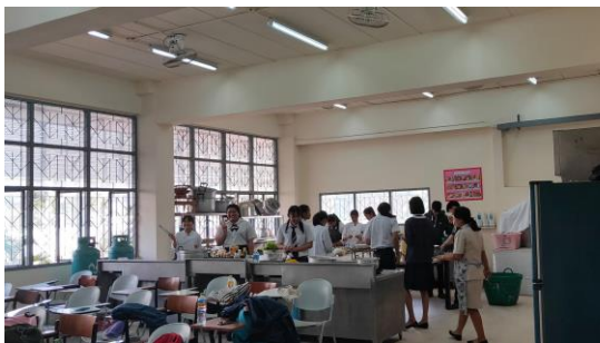
ห้องฝึกปฏิบัติแผนกวิชาอาหารและโภชนาการ