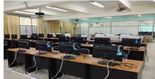
ห้องปฏิบัติการทางภาษา