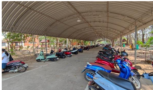
โรงจอดรถจักรยานยนต์