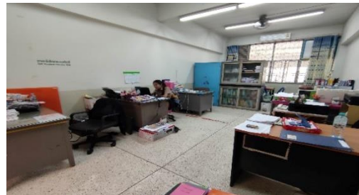
ห้องทวิภาคี