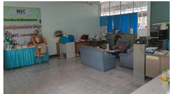
ห้องงานปกครอง