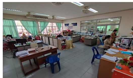
ห้องปฏิบัติการสำนักงานวิจัย